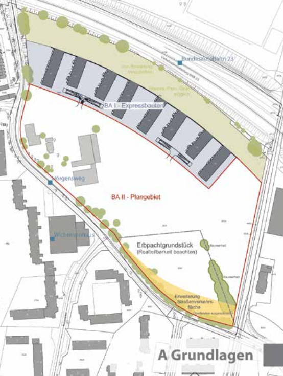
Bürger*innen markieren ihre Wünsche und Ideen