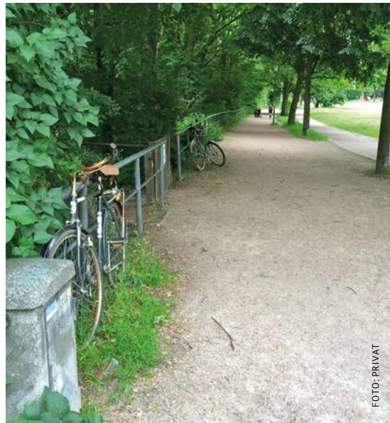
An einem der wenigen trockenen Tage im Jahr

Die großzügige Auslegung dieser Beschlüsse durch das Bezirksamt ging für manche über die Schmerzgrenze, aber der Knoten löste sich. Das Amt entwarf einen runden Tisch für den gesamten Isebek-Grünzug und besetzte ihn paritätisch mit allen Beteiligten: AnwohnerInnen und NutzerInnen, GrundeigentümerInnen, Ökologische Verbände und Initiativen, Lokale Vereine und Institutionen sowie die Eimsbütteler Bezirkspolitik.