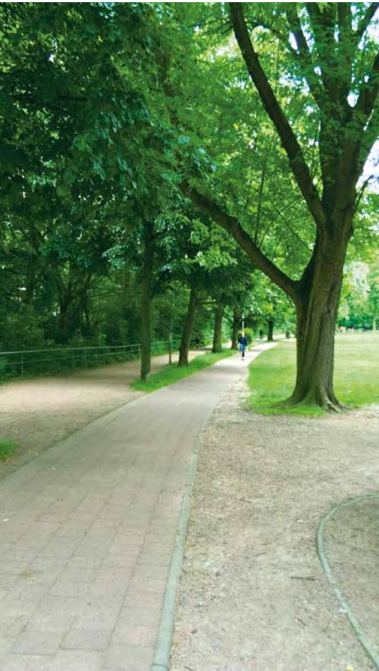
Eine lange Strecke bis zur Einigung

Und auch für die verwahrloste und als Parkplatz missbrauchte Grünfläche nördlich des Isebekkanals steht eine naturnahe und aufenthaltsfreundliche Lösung kurz bevor. Eine Deliberation steht allerdings noch aus: Die Mitglieder des runden Tisches erzielten ein Patt bei der Abstimmung darüber, ob dort eine Bike+Ride-Zusatzfläche oder eine grüne Parkfläche entstehen soll. Die Entscheidung soll nun die Politik treffen, das gerade unsere Partei vor ein Dilemma stellt. Aber so kommt es, wenn die Grünen in einem Stadtteil die stärkste Partei werden: Dass der KFZ-Parkplatz dort wegkommt, wurde nämlich schon mal vorsorglich beschlossen.