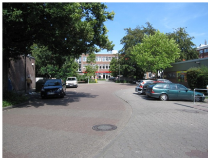
Hintere Ansicht des Centers.

Für uns als Fraktion beginnt nun eine spannende Zeit. Zwei Bürgerbegehren werden voraussichtlich aufeinander