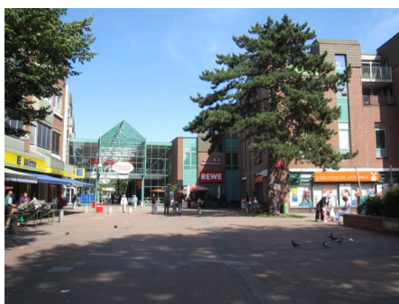
Eingang des Eidelstedter Centers.

Es gäbe aufgrund der Nähe zum Wochenmarkt keinen Raum für Begegnungsflächen und das lauschige Shop-