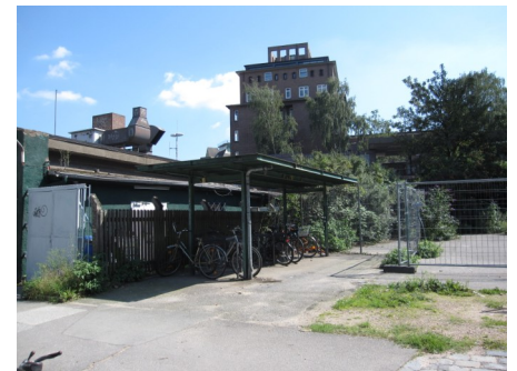
Derzeitige Bebauung an der Hoheluft-Chaussee.

Vielleicht wird es ja künftig möglich sein, dass die Menschen aus dem Stadtteil sowie Politik und Verwaltung ge-