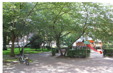
Spielplatz und Bäume am Eidelstedter Center.

So forderten wir in der BV im Mai 2011, dass der Bezirk das Gespräch mit dem Investor suchen solle und baten diesen zur Vorstellung seiner Pläne in den Regionalausschuss Stellingen, der aus diesem Anlass im Eidelstedter Bürgerhaus tagte. An diesem Tag gab es ein Novum in der Tagesordnung des Ausschusses, denn alle Fraktionen einigten sich darauf den Anwesenden Bürgern (ca. 50) die Möglichkeit zu geben, Fragen an den Investor bzw. den ihn vertretenden Projektentwickler zu richten. Dieser hält im Übrigen an seiner Position fest, da aus seiner Sicht eine Erweiterung des Centers nur dann lukrativ ist, wenn man große Ladenflächen anbieten kann. Mit einer Umbauung der Bäume