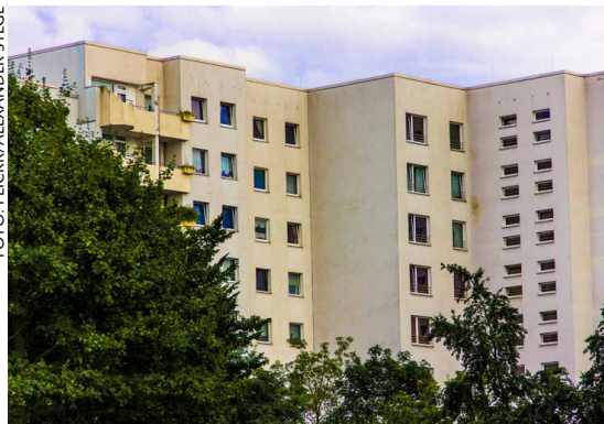
Wohnraum ist knapp in Lokstedt