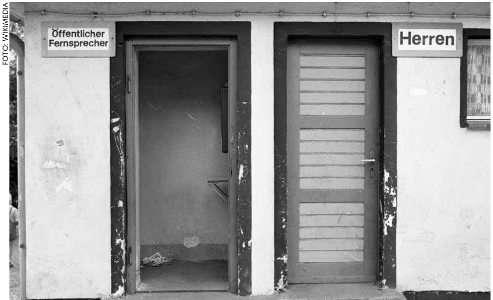
Gepflegte und barrierefreie öffentliche Toilettenanlagen gehören zu einer guten städtischen Infrastruktur.

Die Bezirksversammlung spricht sich für neue Standorte im Unnapark im Stadtteil Eimsbüttel aus, in Stellingens Zentrum und am Siemersplatz. Am S-Bahnhof Elbgaustraße befindet sich ein Pissoir, welches aus Sicht des Bezirks aufgrund der Lage eher weniger benutzt wird. Da dieser Standort ein wichtiger Umsteigepunkt ist, wird hier ein Standort für eine öffentliche Toilettenanlage für sinnvoll gehalten.