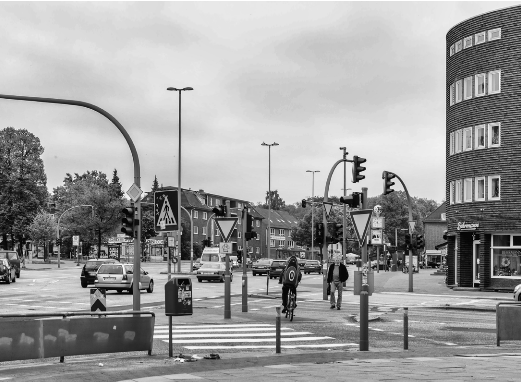
Siemersplatz: Mehr als 180.000 Autos kreuzen hier täglich auf mehreren Spuren.

Planung besonders berücksichtigt werden. Parkende Fahrzeuge dürfen in Zukunft nicht mehr die Sicherheit von RadfahrerInnen beeinträchtigen oder FußgängerInnen auf dem Bürgersteig den Weg versperren. Bei mög-