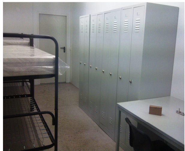
Zweckmäßig: Container-Unterkunft für Flüchtlinge in Lokstedt

Auch für die Bezirksfraktion steht das Thema öffentliche Unterbringung, also u.a. die Unterbringung von Flüchtlingen im Bezirk, immer wieder auf der Tagesordnung. Vieles was geschieht sehen wir auch kritisch: So ist die Unterbringung in Containern für uns nur eine Notlösung. Viel lieber wäre es uns, wenn wir den Menschen, die hier Zuflucht suchen, Wohnungen in Häusern anbieten könnten. Wir rechnen damit, dass in den nächsten Monaten noch mehr Flüchtlinge nach Hamburg kommen, für die neue Container-Unterkünfte entstehen werden.