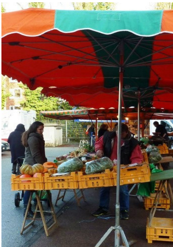
Alles frisch: Markt am Mittwoch