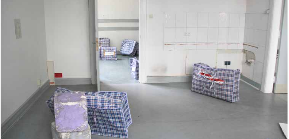
Alle Bezirke müssen ihre Kapazitäten deutlich erweitern