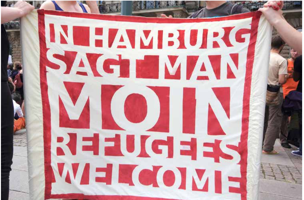
Für eine offene Willkommenskultur