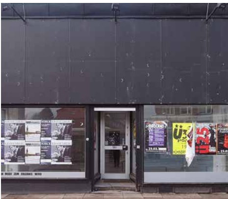
Triste Ladenfronten an der Hoheluft